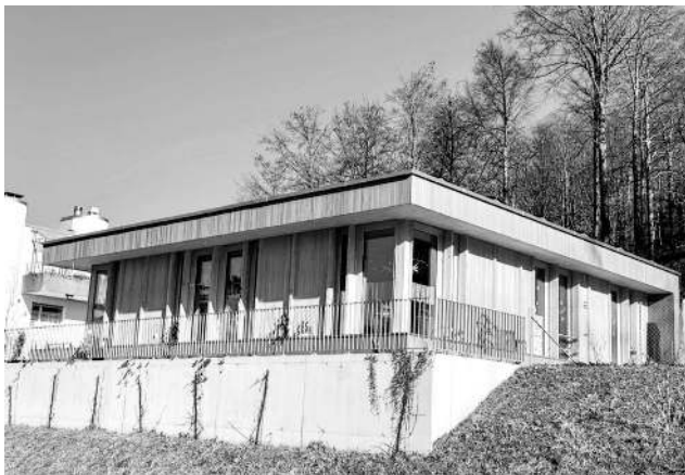
Neubau Kindergarten Wiesenstrasse 24

Daneben bildeten die Solarstrategie, das Klimareglement, die Gesamtplanung Schulanlage Rothus, der Wettbewerb für die Sporthalle Forelstrasse sowie das Projekt für den Kunstrasen auf dem Sportplatz Oberfeld weitere Schwerpunkte.