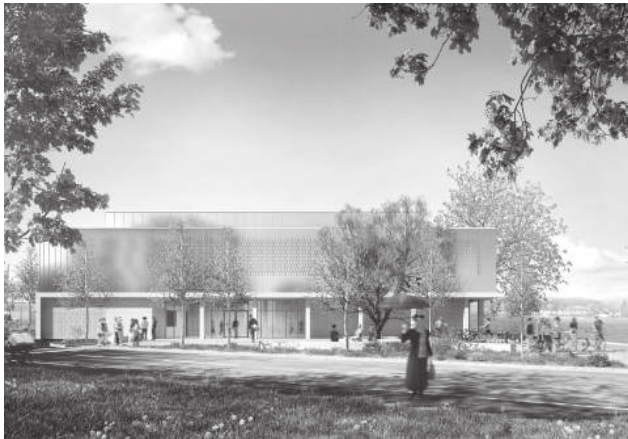
Visualisierung Sporthalle Forelstrasse

Anfangs 2023 wurde der Architekturwettbewerb gestartet, im Mai wurden 41 Projekte eingereicht. Die Jury hat das Projekt «Mary Poppins» als klares Siegerprojekt bestimmt. Das Generalplanerteam hat mit den Arbeiten am Vorprojekt begonnen, das Bauprojekt und der Kostenvoranschlag sollen bereits im Frühjahr 2024 vorliegen. Läuft alles auf Kurs, findet die Volksabstimmung über den Ausführungskredit im November 2024 statt.