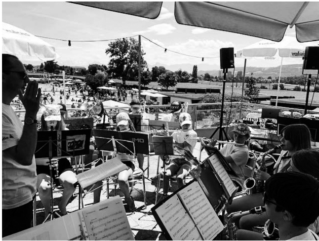
Badi-Fest JMO und Mundige Fescht Schülerband